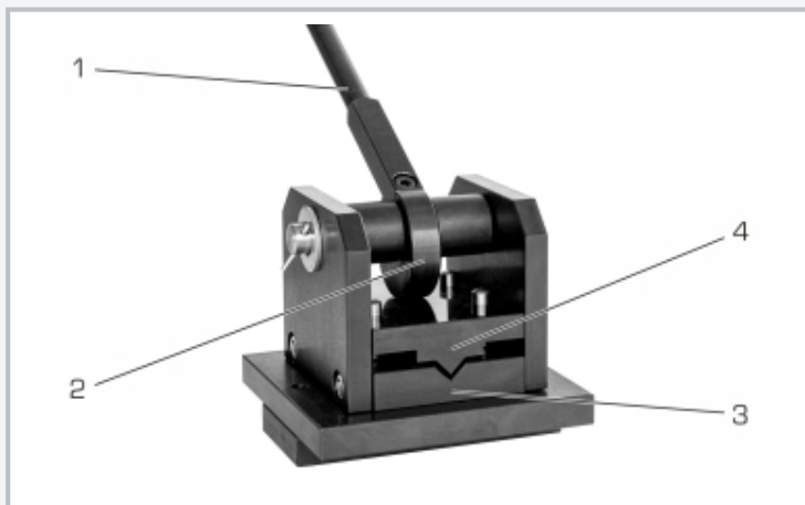
1 palanca, 2 excéntrico, 3 punzón inferior, 4 punzón superior