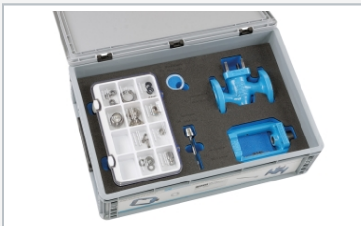
Sistema de almacenamiento con espuma de embalaje: todos los componentes tienen su lugar fijo, la espuma está etiquetada