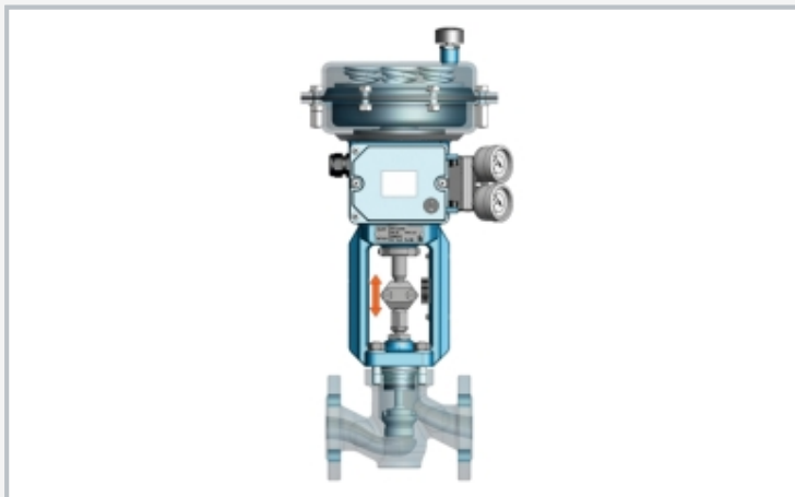
Dibujo seccional transparente de la válvula de control montada (captura de pantalla del vídeo de montaje)