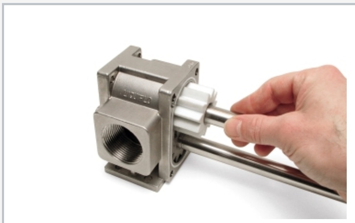
Montaje de la bomba de engranajes: Montar el árbol motor