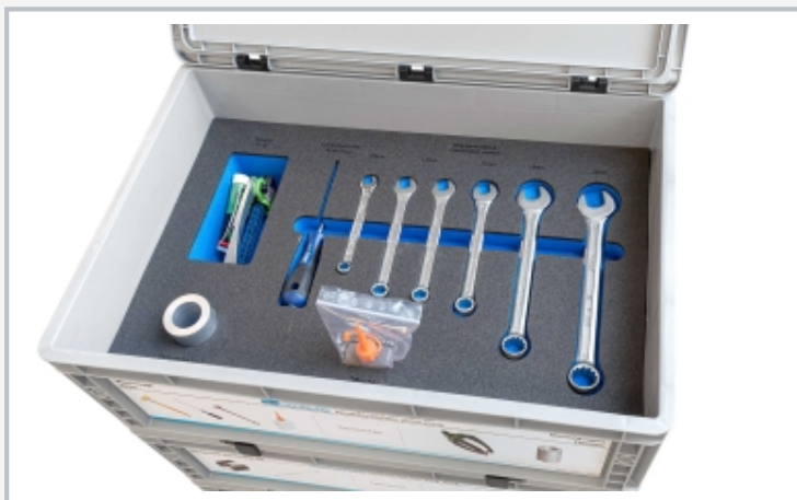
Sistema de almacenamiento con espuma de embalaje: herramientas