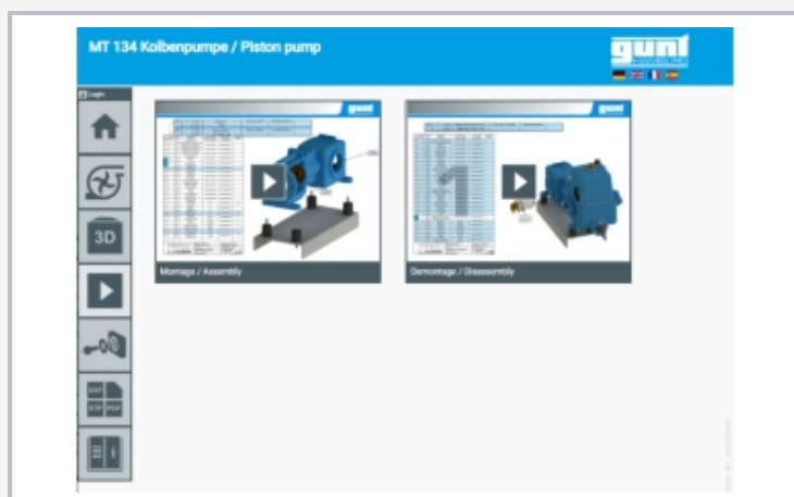
Captura de pantalla del GUNT Media Center