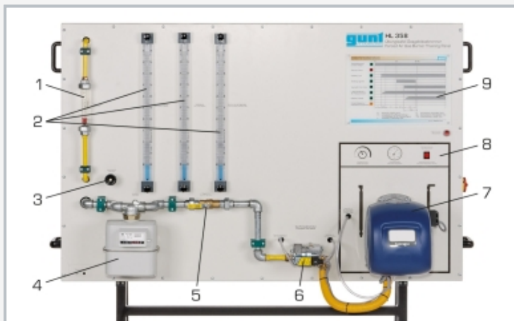
1 caudalímetro, 2 manómetro, 3 válvula de cantidad de gas, 4 contador de gas, 5 grifo de bola, 6 instrumento compacto, 7 quemador, 8 elementos de mando de calefacción, 9 secuencias de control del quemador