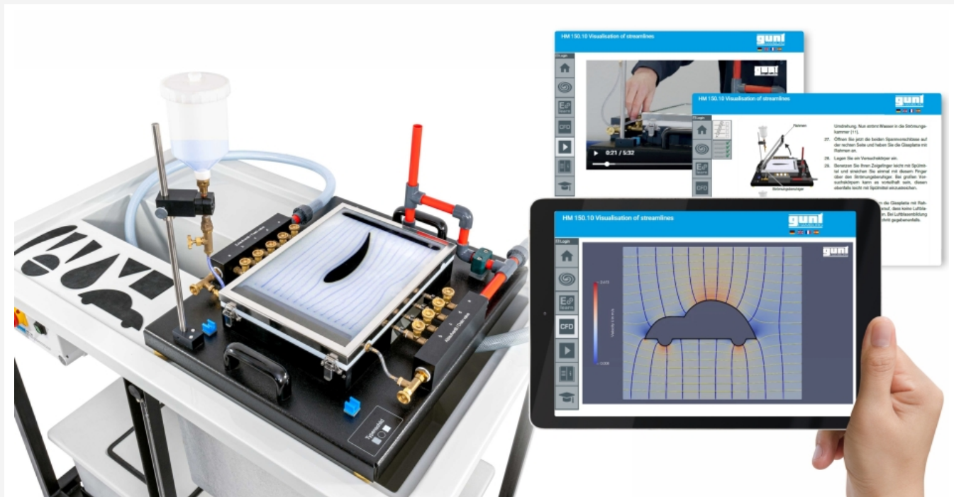
La ilustración muestra el dispositivo sobre la superficie de trabajo del módulo básico HM 150 y el GUNT Media Center, tablet no incluida