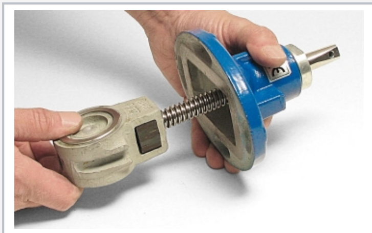
Montaje de la compuerta